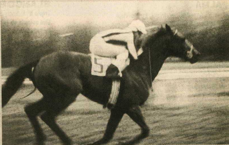
Castelnuovo, el notable hijo de Roy, ganador de 5 cs. y de la Triple Corona de Productos 1994 en el Valparaíso Sporting Club. Mañana debuta en el Hipódromo Chile su hermano materno Knightbridge.

Toss). Criado en el haras "Mocito Guapo". Hermano materno de Batchet, Fap y de Señora Isabel.