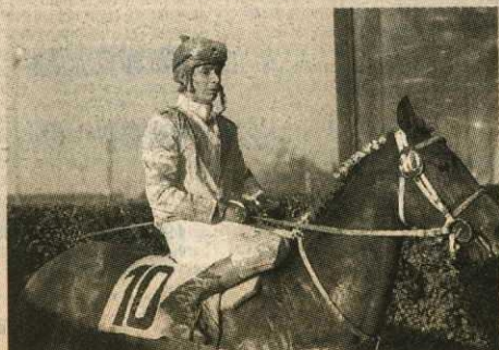
Vasca Furia, la excelente corredora hija de The Great Shark, vencedora en tres compromisos, inclusive en el St. Leger de Grupo I. El lunes inicia campaña en el Club Hípico su hermana materna Vamos Cariño.

MARIA ANASTASIA (Onward II y Escultura, por Riverhill). Criada en el haras Dadinco. Propia hermana de Iguala y de Jacoba.