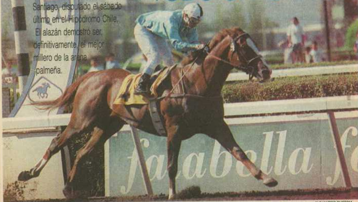
Real Congress concreta cómodamente su victoria en el clásico Ciudad de Santiago. El defensor del San Thomas demostró, en el estelar palmeño, que es el amo y señor de la milla arenera.

El alazán demostró ser, definitivamente, el mejor millero de la arena palmeña.