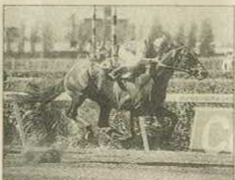
Prepo fue muy votado también en la elección del mejor caballo de la década. La gente no olvida su hazaña en el Latino.