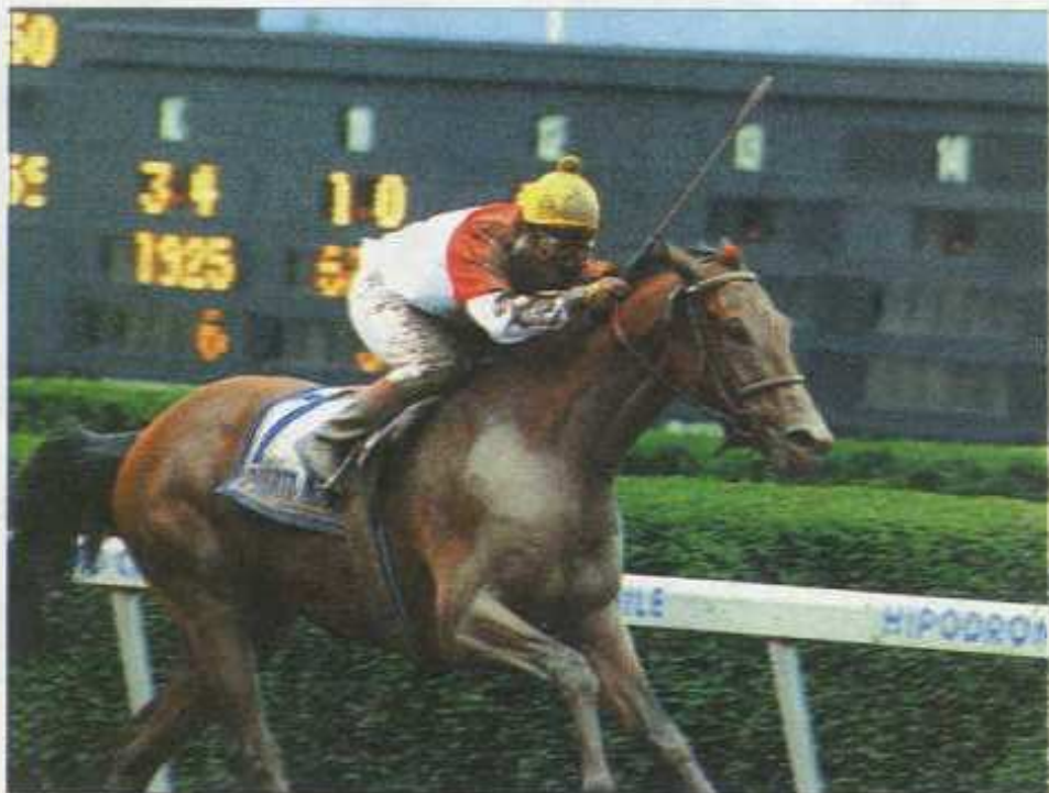
Puerto Madero, junto a Malek, es el mejor abanderado de nuestra hipica en los Estados Unidos. La Copa Dubai, a fines de marzo, es la próxima escala del nieto de Saratoga Game.

El segundo precio más alto que se pagó en 1998 por un potrillo, 42 millones de pesos, fue, precisamente, por el propio hermano de Puerto Madero, adquirido por los mismos propietarios del gran corredor. Vuelve Triunfante, por efectos de nacimiento, está atrás un semestre en edad, respecto a sus similares de la generación. Por tal motivo, Richard Mandella, su preparador, decidió darle más tiempo para que madure y se equipare con el resto antes de debutar y defender los mismos colores que su hermano en las pistas.