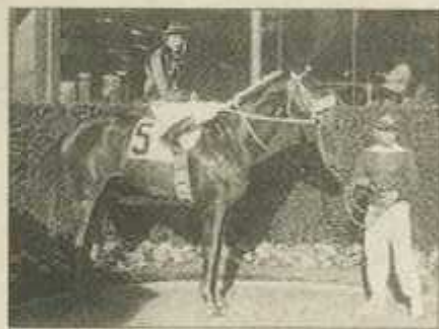
Malek fue otro de los escogidos, aunque principalmente por su producción internacional. Sus logros remecieron el ambiente, en especial el "Santa Anita Handicap".